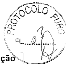
TABELA DE PONTUAÇÃO DE TÍTULOS