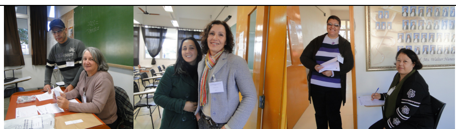
Alguns fiscais de Sala, aqui representando o total de 423 fiscais que atuaram em nosso concurso do dia 03/06/2012